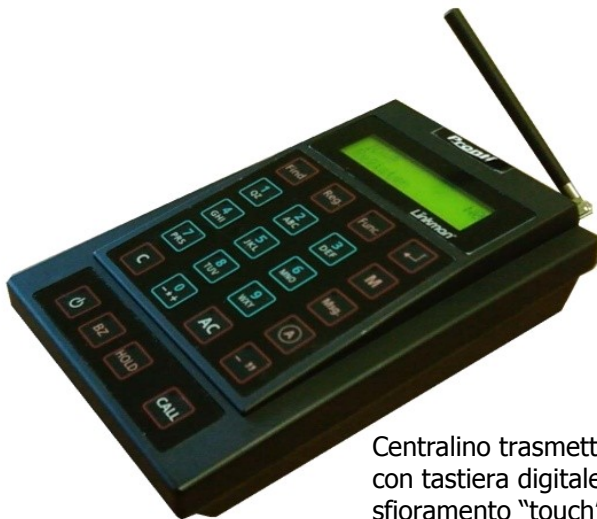
Centralino trasmettitore con tastiera digitale a sfioramento "touch"