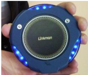
Disk Pager PT-D900