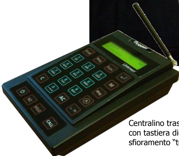
Centralino trasmettitore con tastiera digitale a sfioramento "touch"