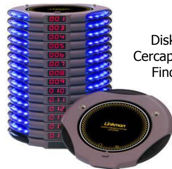
Disk Pager Cercapersone Fino a 999

Sistema ideale per avvisare con facilità e discrezione i clienti di ritirare al banco la propria ordinazione